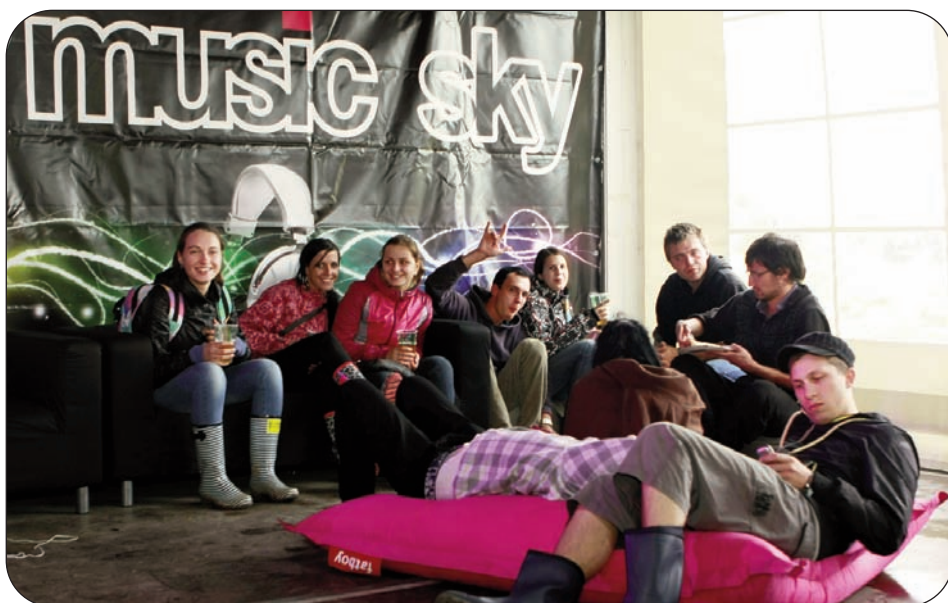
Zábavy je všude dost, zejména v T-Music Sky.