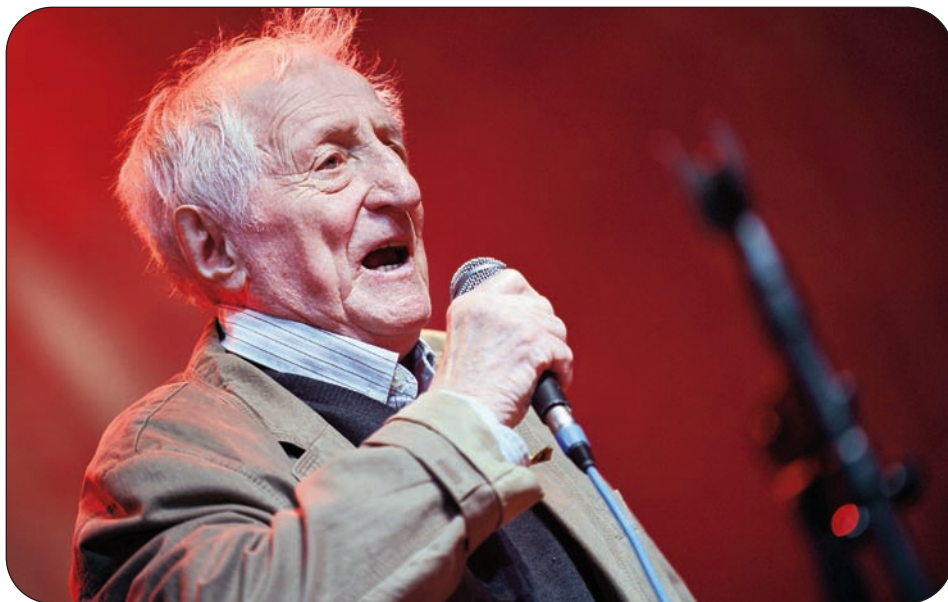
Pavel Bobek absolvoval první koncert po třech měsících léčení.